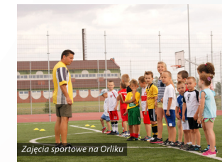
Zajęcia sportowe na Orliku

Podobnie Gminny Ośrodek Pomocy Społecznej w Osiecinach zrealizował 4 projekty na łączną kwotę 720 902 zł, zdobywając ze środków Unii Europejskiej kwotę w wysokości 645 208 zł. W ramach tych projektów udzielono wsparcie łącznie 136 mieszkańcom Naszej Gminy. Zorganizowano różnego rodzaju kursy i szkolenia, dzięki czemu osoby uczestniczące w projektach mogły podnieść swoje kwalifikacje zawodowe oraz zwiększyć szanse znalezienia pracy. Na realizację programu Asystent Rodzinny pozyskaliśmy 58 503 zł. Program ten został skierowany do rodzin przeżywających trudności opiekuńczo – wychowawcze. Z pomocy Asystenta Rodziny korzystają obecnie 24 rodziny w tym: 53 dzieci.