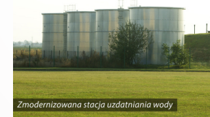
Zmodernizowana stacja uzdatniania wody