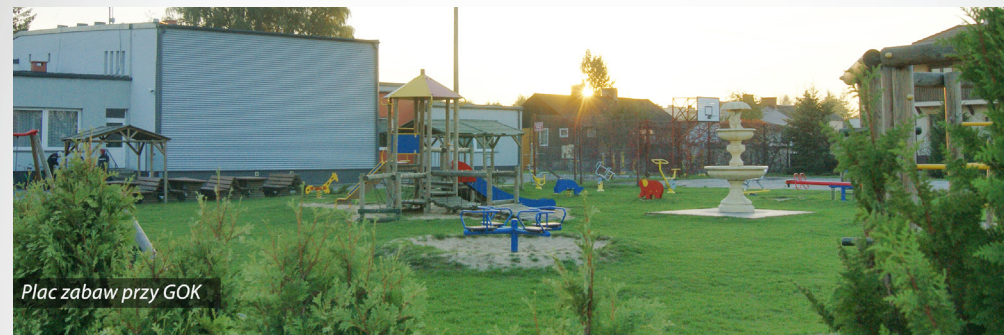
Plac zabaw przy GOK

- zakupiono do szkół 15 tablic interaktywnych (klasy 1-3) i 9 tablic (klasy 4-6 – w trakcie realizacji)